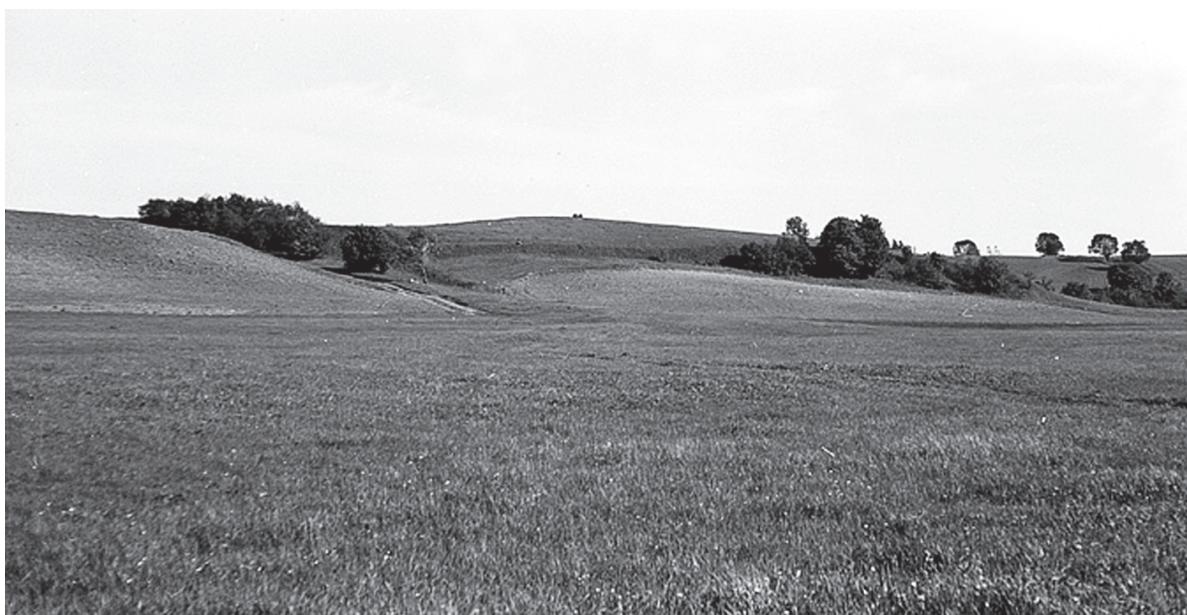
Valėnų piliakalnis – ankstyvoji Kretingos piliavietė.

Legendą apie karaliaus Armono pastatytą pilį patvirtinančių istorinių šaltinių neturime, o pirmieji Kretingą minintys ra-