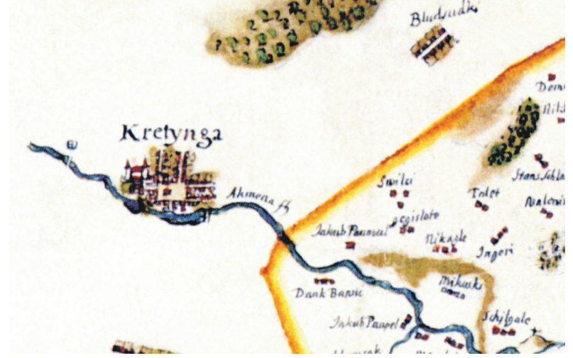
Kretingalės ir Kretingos apylinkių XVIII a. žemėlapis. Dešinėje pusėje prie Dangės pavaizduotas kalvoje stūksantis kryžius, manoma, 1253 m. dievams kretingiškių paaukotam Klaipėdos pilies komtūrai atminti. Klaipėdos Mažosios Lietuvos istorijos muziejus.

Subūrę gausesnes pajėgas ir vedami Livonijos krašto magistro Vernerio fon Breithauzeno,