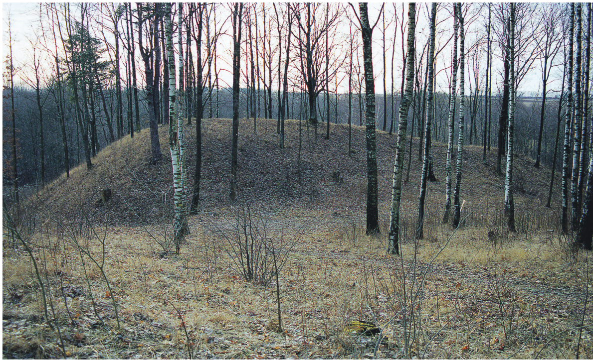
Ēgliškų – Kretingos pilies alkalkalnio, vad. Perkūnkalniu, vaizdas iš šiaurės rytų pusės. Fot. Julius Kanarskas, 2003 m.

– Saveidžiui ir Tvertikiui – turėjo atitekti pilies apygardai paliktos kitos trys apylinkės.