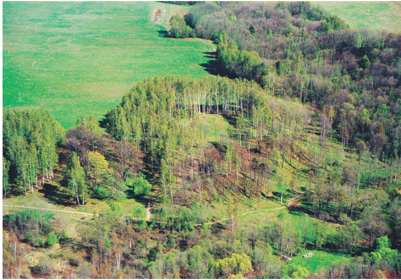
Ēgliškų piliakalnio – Kretingos piliavietės vaizdas skrydyje iš šiaurės vakarų pusės. 1996 m.

Per pilies dalybas Livonijos magistras ir Kuršo vyskupas galėjo pasiimti arčiau Klaipėdos buvusią pietinę apygardos dalį, t. y. Sarčių–Kretingalės–Lankučių apylinkes. Likusi dalis su pilimi buvo palikta keturiems kuršių didikams. Vargu ar visi jie drauge vienu metu galėjo valdyti pilį. Dalybų dokumento tekstas sufleruoja, kad aukščiausio rango didiku vokiečiai laikė Veltūną, kuris tapo Kretingos pilies ir jai priklausančios apylinkės valdovu. Jo broliui Reiginui bei kitiems dviem didikams