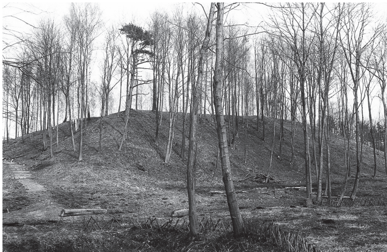
Ēgliškių piliakalnis iš pietų pusės.

šytiniai šaltiniai pasirodė XIII a. viduryje, Lietuvos pajūryje gyvenusių pietinių kuršių krikštų susidomėjus Livonijos ordino kryžiuočiams. Lietuvos pajūrio gyventojų krikštą kryžiuočiai pradėjo 1252 metais, užėmę pietinių kuršių žemes ir pastatę naujakrikštų kraštui administruoti Klaipėdos (Memelburgo) pilį. Kryžiuočių sąjungininkais tapo kuršių didikai Veltūnas (Velthune), jo brolis Reiginas (Reygin), Tvertikis (Twertiken) ir Saveidis (Saweyde), kurie realiai vertino kryžiuočių galybę. Lietuvos valdovui Mindaugui apsikrikštijus, jie krikščionis į savo valdas įsileido taikiai. Siekdami išsaugoti dalį valdų, pasirinko Livonijos ordino globą ir pasižadėjo kartu su pavaldiniais krikštytis. Kitų metų pavasarį Kuršo vyskupas Henrikas ir Livonijos ordino magistras Andrius fon Štirlandas susitarė dėl užimtų žemių dalybų. 1253 m. balandžio 5 d. Kuldygos pilyje pasirašytu aktu buvo padalinta visa užkariauta Vakarų Lietuvos teritorija.