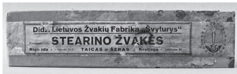
Kretingoje pagamintų stearino žvakių pakuotė. XX a. 4 deš. I pusė. Kretingos muziejaus istorinės buities rinkinys.