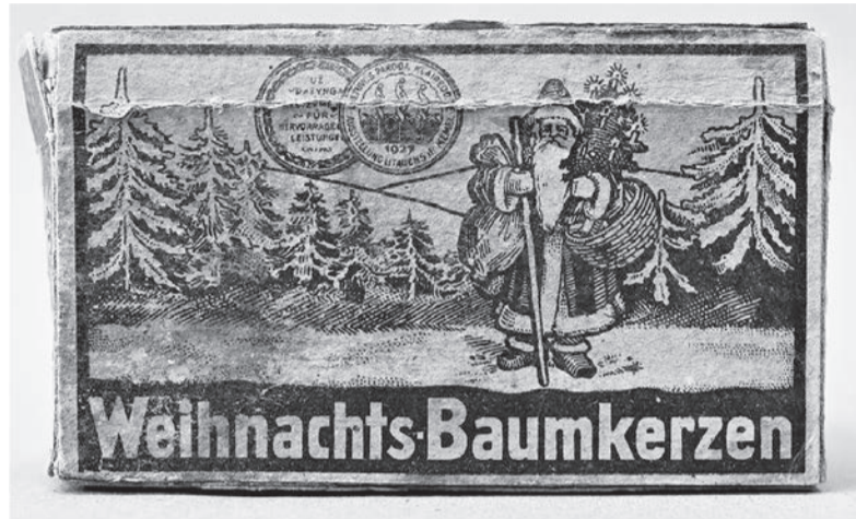
Kretingos žvakių fabriko kalėdinių eglių žvakučių dėžutė. Apie 1937 m. Kretingos muziejaus istorinės buities rinkinys.