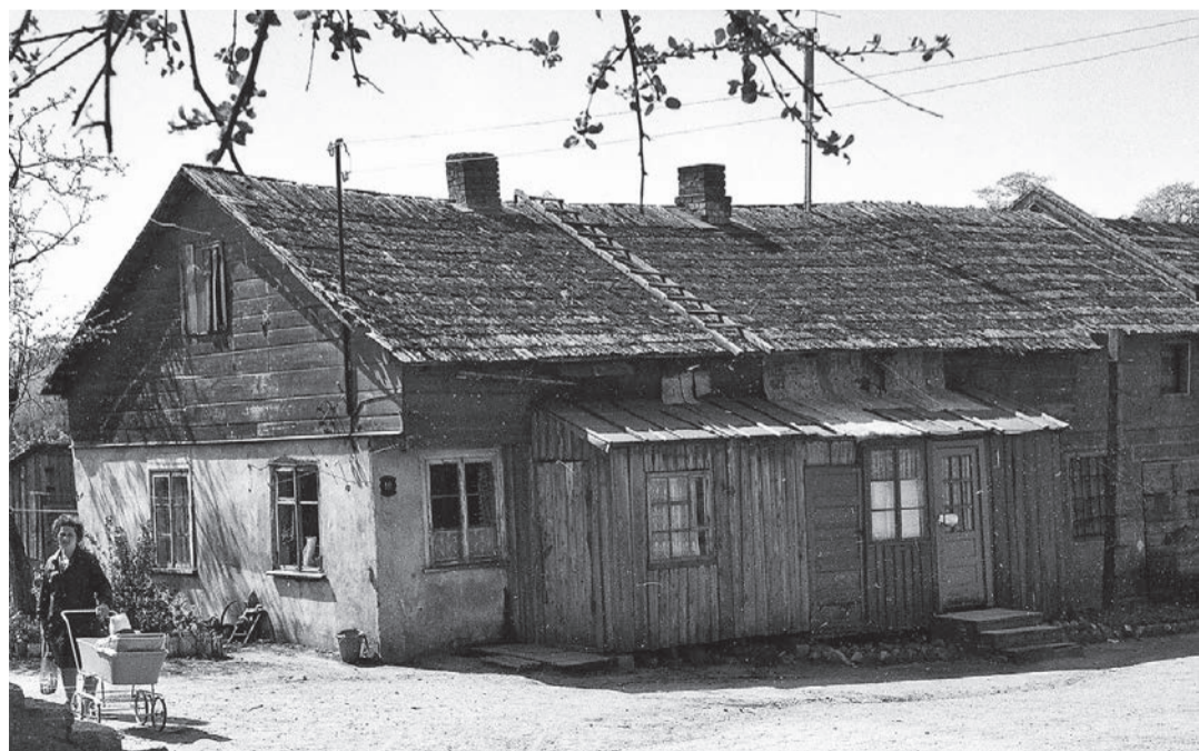
Buvusio Didžiosios Lietuvos žvakių fabriko „Švyturys“ pastatas (Birutės g. 16). Fot. Steponas Kaštas. 1970 m. Nuotrauka iš Kretingos muziejaus ikonografijos rinkinio.