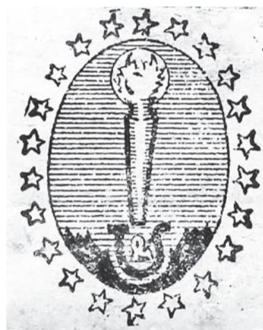
Didžiosios Lietuvos žvakių fabriko firminis ženklas su jūrų švyturio atvaizdu. XX a. 3 deš. Kretingos muziejaus rinkinys.

tis, stačiakampio plano, rytiniu galu atsuktas link gyvenamojo namo, tinkuoto mūro sienomis ir dvišlaičiu medinės konstrukcijos stogu. Patalpos buvo pakankamai šiltos, todėl žvakių liejimo procesas jame vyko visus metus.