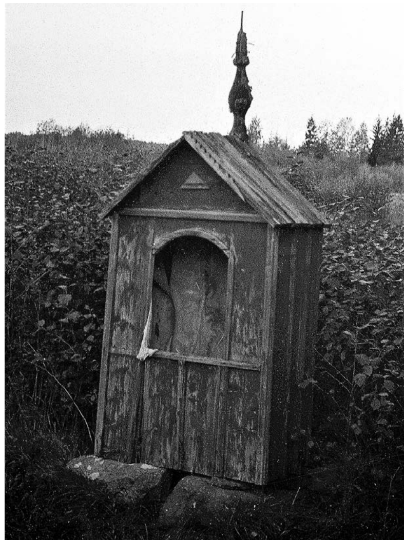
Koplytėlė Sungailų kaime. Juozo Mickevičiaus nuotr., 1966 m. Kretingos muziejaus Ikonografijos rinkinys (KM IF 6205).

XIX amžiuje formuojantis regione naujam kelių tinklui, kaimo žemių vakarine dalimi buvo nutiestas naujasis Voveraičių–Šukės vieškelis, kuris praėjo šalia gyvenvietės sodybų ir tebe-naudojamas iki mūsų dienų.