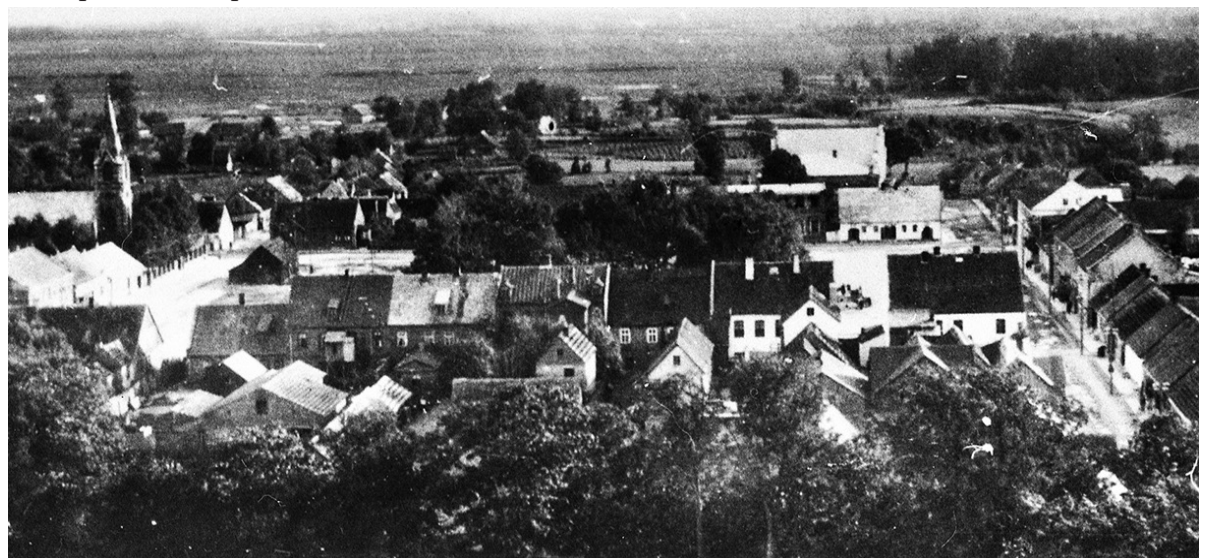
Aikštės vaizdas nuo pranciškonų bažnyčios bokšto. Apie 1930 m. Kretingos muziejus.