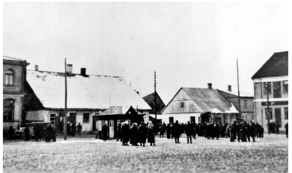
Viešosios aikštės pietvakarinis kampas. Kretingiškiečiai pasitinka iš vokiečių aneksuotos Klaipėdos evakuotus gyventojus, tarnautojus ir karius. Dešinėje – Ūkio banko ir apskrities viršininko administracijos pastatas, ties viduriu – Birutės ir Mėguvos gatvių kampe stovėjęs namas, kairėje – Rūpužinė vadintas namas, į kairę nuo kurio – notaro J. Kentros namas. Priešais juos aikštėje stovi prekybos kioskas. 1939 m. kovo 23 d.