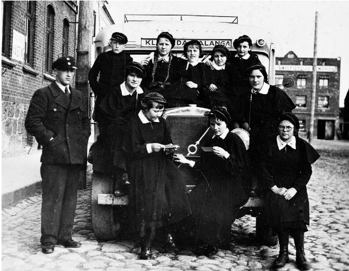
Kretingiškieji moksleiviai prie maršrutinio autobuso Klaipėda–Kretinga–Palanga šalia V. Grudzinsko vaistinės. XX a. 4 deš. I p.