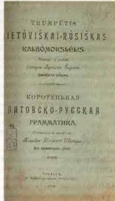
► Kunigo Ignoto Šoparos parengto ir 1906 m. išleisto lietuvių-rusų kalbų elementoriaus „Trumputis lietuviškai - rusiškai Lietuvos švietimo istorijos muziejus.“

ūkis buvo prijungtas prie Kartenoje įsikūrusio Žemaitės kolūkio. Kaimo gyvenimą XX a. 7–8 dešimtmečiais pakeitė melioracija. Jos metu dauguma žmonių iš vienkiamų buvo perkelti į kolūkinį gatvinį kaimą, kuris praktiškai susilijo su į pietus nuo jo palei kelią išaugusiais Gintarais.