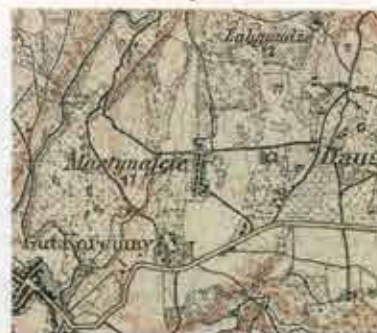
► Martynaičių kaimo 1900–1915 m. planas. Ištrauka iš Prūsijos karalystės kartografo 1915 m. sudaryto Kartenos apylinkių topografinio žemėlapiu.