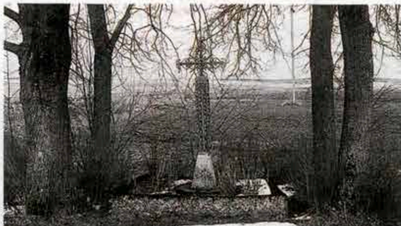
► Kaimo kryžius, pastatytas 1901 m. Fot. Julius Kanarskas, 1997 m.

ko ir Veronikos Kubilių šeimyna, kurią sudarė 11 asmenų: 5 šeimos nariai ir 6 įnamiai. 10 asmenų (4 šeimos nariai ir 6 įnamiai) gyveno Antano ir Kotrynos Dauginčių namuose. Kitose šeimynose buvo nuo 6 iki 9 asmenų. Mažiausias Pranciškaus ir Rozalijos Pocių bei Pranciškaus ir Petronėlės Bučkorių šeimas sudarė 4–5 nariai – tėvai su vaikais.